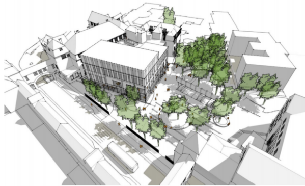
En skiss ur detaljplaneförslaget visar hur den nya byggnaden kan se ut, ut mot Allhelgona Kyrkogata. Bild: Skiss: Jais arkitekter/Lunds kommun

– Här vrider man den nya byggnaden så den ligger på snedden. Våldigt fult, säger han.