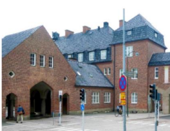
Biskopshuset skymtar i fonden

1913-16 byggdes Södra lasaretsområdet i kv Paradis ut enligt ritningar av arkitekten Salomon Sörensen. Utbyggnaden innebar ett kliv över stadskärnans nordgräns och visuell samverkan med tre utanförliggande äldre märkesbyggnader, alla i rött tegel: Biskopshuset i "medeltidsstil" av Brunius (1845), Allhelgonakyrkan i nygotik av Zettervall (1891) och Universitetsbiblioteket i "hansa-renässans" av Hellerström (1907). Sörensen löste skickligt uppgiften med ny arkitektur som knöt samman stadskärnan med de tre befintliga byggnaderna; han valde rött tegel och samstämda byggnadsvolymer med valv, torn och gavlar som genomgående motiv. Ett nytt stadsrum skapades mellan de två valvburna broar som förbinder de båda lasaretsområdena och samtidigt bildar två "portar" i en tredelad rums-sekvens av Allhelgona Kyrkogata, som - belägen strax norr om Norra vallgatan - följer den forna stadsvallens läge. Resultatet blev ett unikt sammanhållet och rumsligt välartikulerat stadsparti som vi fått som gåva att förvalta för framtiden.