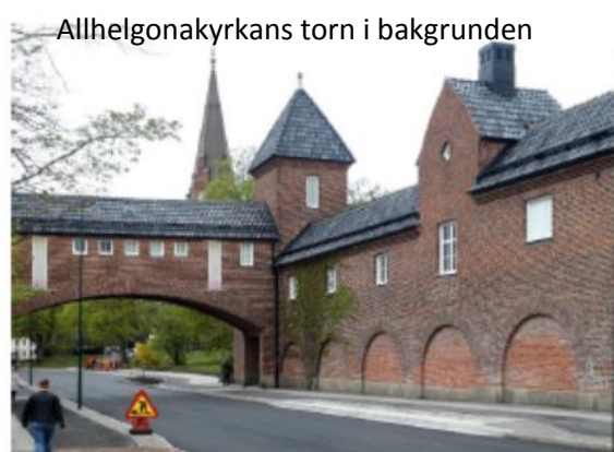
Allhelgonakyrkans torn i bakgrunden