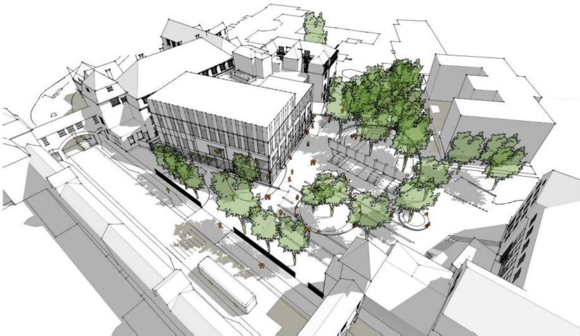
Alternativ A, högdal orienterad mot Allhelgona Kyrkogata. Akademiska Hus, visualisering Jais arkitekter.

Den vridna byggnadskroppen bryter omotiverat mot dels det i stadskärnan gängse byggnadssättet med huskroppar längs gatan, dels specifikt mot just vallgatornas fasta bebyggelsegräns innanför vilken den medeltida stadens gatunät tar vid, samt även mot den harmoniskt sammanhållna gatusekvens som Sörensen skapade.