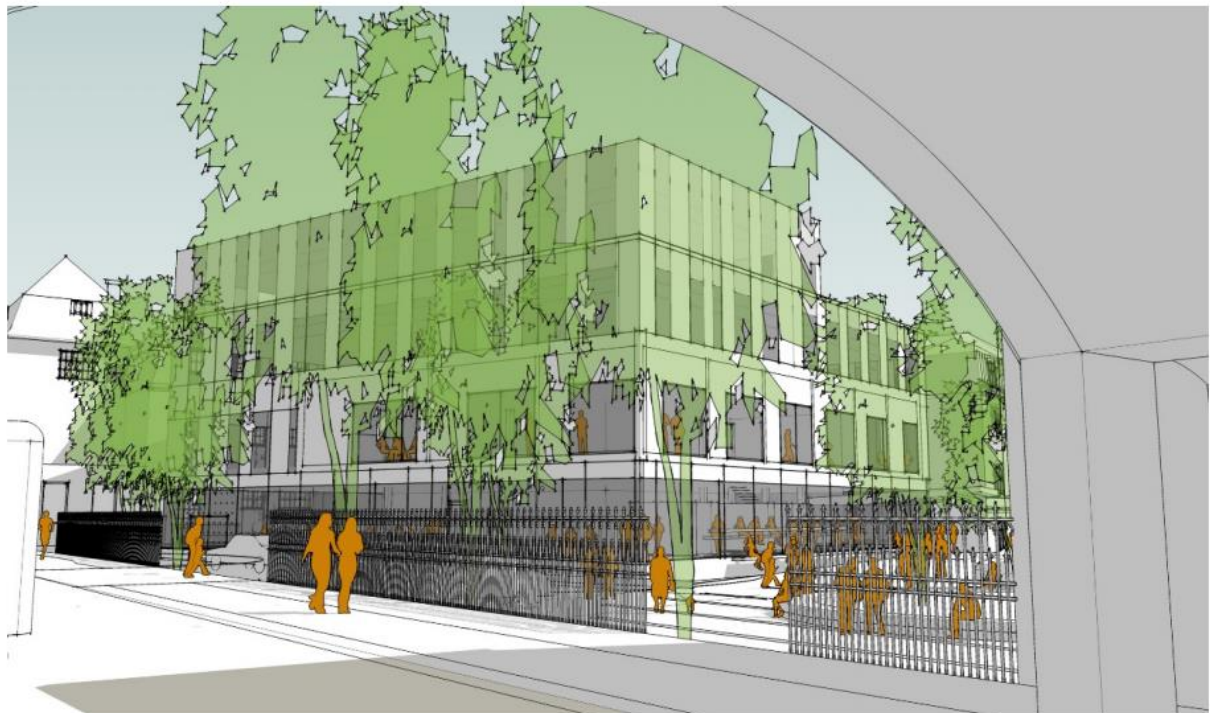
Alternativ A; högdal orienterad mot Allhelgona Kyrkogata. Akademiska Hus, visualisering Jais arkitekter.

Bestämmelsen framstår som märkligt oprofessionell på flera sätt. Dels i framhävandet av en enstaka ny byggnad på bekostnad av en större, kulturhistoriskt värdefull stadsmiljö ("allt ljus på mig"). Dels i sin naiva bedömning av material- och färgverkan (är hus i gult tegel alltid mer inbjudande än hus i rött tegel?). Dels i det svårförståeliga valet av f d Barnbördshuset att ansluta till; en byggnad som ligger långt inne i kvarteret och vänder baksidan mot den aktuella tomten och blir helt skydd från Allhelgona Kyrkogata